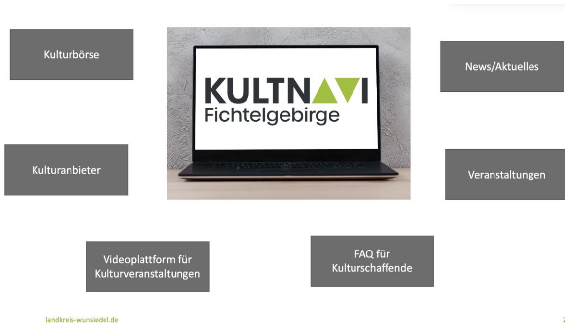
Abb.: Kernelemente des »KultNavi«

Diese Ziele sollen mit den folgenden Kernelementen des »KultNavi« erreicht werden: