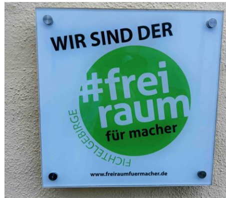
Abb.: Plakette am Eingang des Fichtelgebirgsmuseums in Wunsiedel