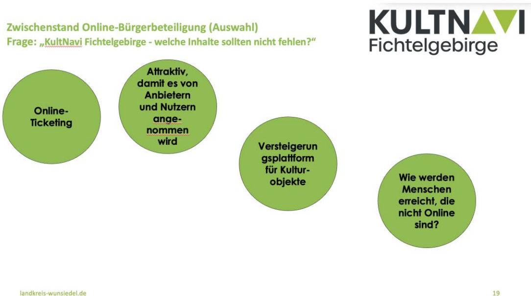
Abb.: Erste Ergebnisse der Online-Bürger:innenbeteiligung zum »KultNavi«