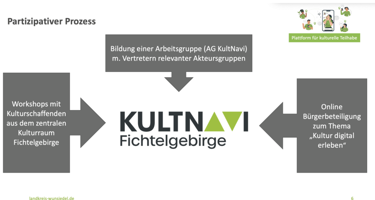
Abb.: Arbeitsstruktur »KultNavi«