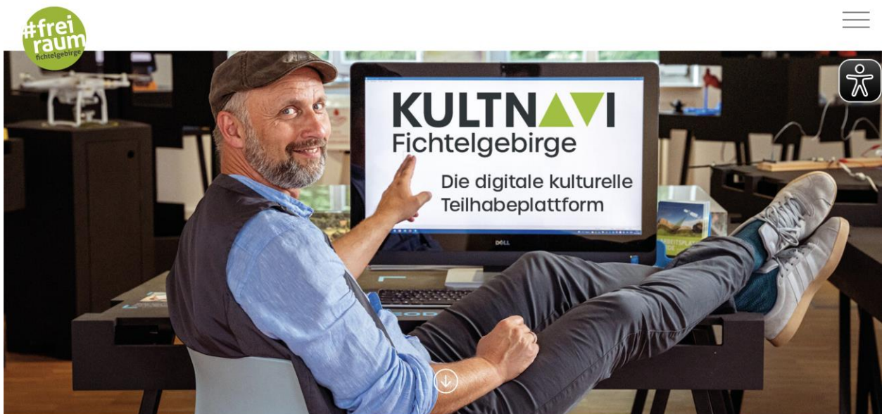
Abb.: Startseite der Projektseite