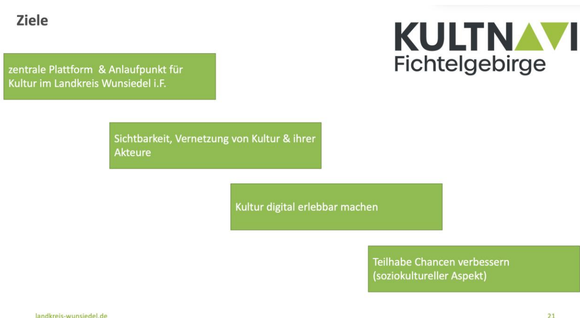
Abb.: Kernziele des »KultNavi«

Darauf aufbauend vertieft Christina Heydenreich nochmals, welche Kernziele mit dem »KultNavi« insgesamt verfolgt werden: